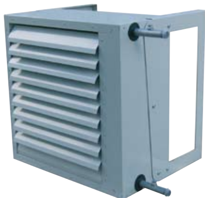
Vandeninis šildytuvas Heating coil Warmwassereizregister Водяные нагреватели