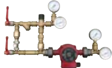
RMG p. 148